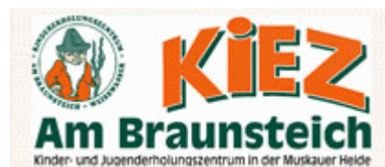
Emblemo de la kongresejo

Ni strebas oferti ŝoforservon (almenaŭ por pakajoj) kaj tutcerte eblas organizi gruptaksion. Se vi ŝatus havi taksion bv. telefoni almenaŭ 30 minutojn antaŭ via alveno al +49 151 10975366 por ke ni povu organizi ĝin por vi.